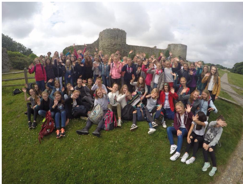
Ausflug zum Pevensey Castle in der Nähe von Hastings

Am Ende der Klasse 7 fahren die bilingualen Schülerinnen für eine Woche nach England. Durch die Unterbringung in Familien haben sie die Gelegenheit, Einblicke in den englischen Familienalltag zu gewinnen und ihre Sprachkenntnisse zu erproben. Tagsüber erwartet sie ein interessantes Sightseeing-Programm, das abhängig ist vom Unterbringungsort (z.B. Oxford oder Hastings), in der Regel aber einen Tag in London einschließt.